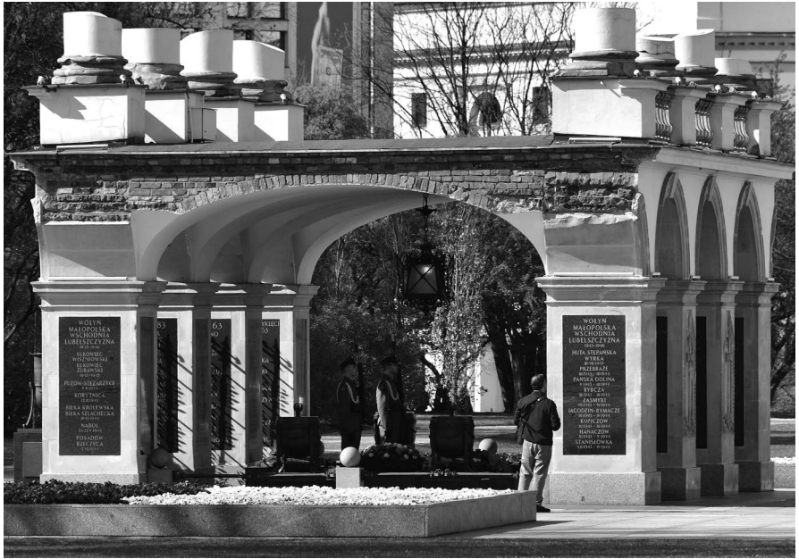
Ilustracja 3. Grób Nieznanego Żołnierza od strony południowej z tablicami z 2017 roku poświęconymi walkom z OUN i UPA.

Obywatelskiej oraz Ludowego Wojska Polskiego. Dodatkowo zaś ekshumacje nie wykluczyły możliwości, by część z ukraińskich bojowników zginęła nie w walce, ale już po niej, w wyniku egzekucji 41 . Prócz zmiany tablic, 10 listopada rano, na dzień przed ich planowanym odsłonięciem, media zostały poinformowane, że uroczystość odbędzie się jednak tego samego dnia bez udziału Prezydenta 42 .