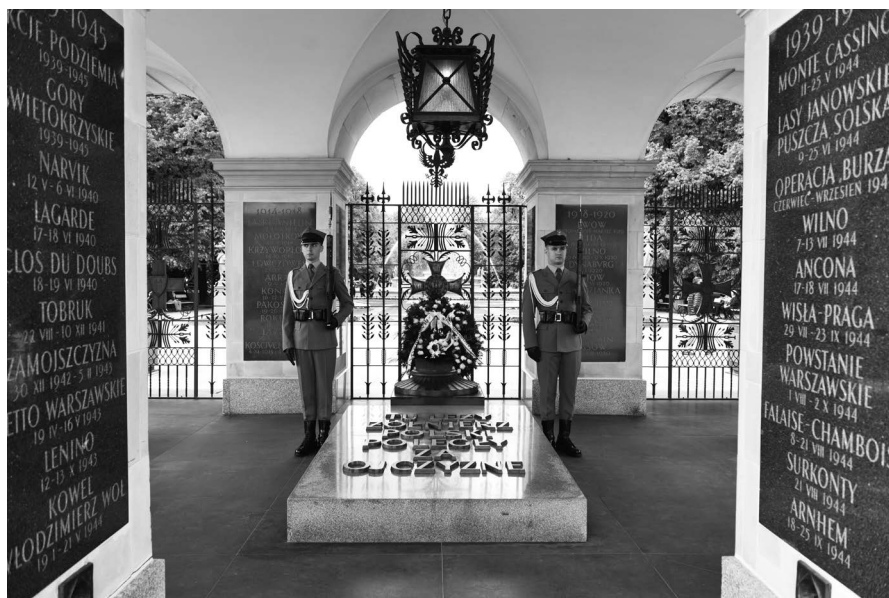
Ilustracja 2. Grób Nieznanego Żołnierza z płytą nagrobną z napisem „TU LEŻY ŻOŁNIERZ POLSKI POLEGŁY ZA OJCZYZNĘ?”, wiecznym ogniem oraz tzw. Tablicami Chwały z wymienionymi polami bitewnymi.

Kształt kultu bohaterów został zatem zasadniczo przeformułowany: przywołano definicję bohatera z okresu II RP (również przywracając nazwę placu), którą znacznie poszerzono – o walki Polaków toczone między rokiem 962 a 1945. O znaczeniu nadanym narracji heroicznej w okresie komunistycznym przypominały już tylko poszczególne elementy, jak ar-