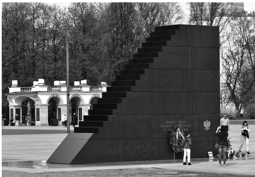
Ilustracja 4. Pomnik Ofiar Tragedii Smoleńskiej, na drugim planie Grób Nieznanego Żołnierza.